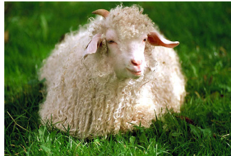
Récolter la laine