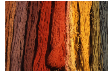
Teinter les fils de couleurs