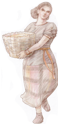
Coudre les tissus ensemble pour obtenir un vêtement