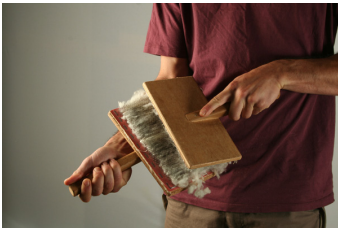
Démêler la laine avec des cardes